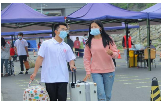
党员工作站学长帮助新生拿行李