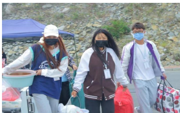
材料学院迎新工作者帮助新同学拿行李