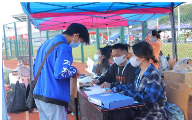
材料学院迎新点为新生登记报到

迎新工作中，学院全体迎新工作人员不辞辛劳，全程耐心的帮助新同学完成开学报道流程直到他们顺利完成寝室登记入住。下午天气变凉，但也挡不住大家的热情，志愿者们满脸笑容，干劲十足，耐心等待 21 级新同学的到来。下午 6 点，全体迎新工作人员核对各项信息，收拾迎新现场物资，迎新工作圆满结束。