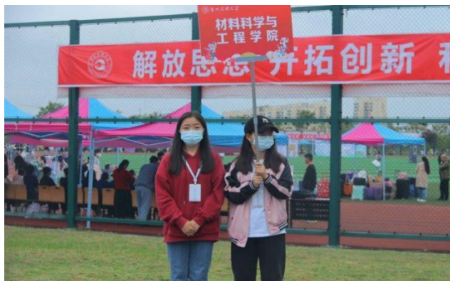
材料科学与工程学院老生举着院系牌子迎接新生入学