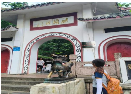
图 1 曹封美同志参观红色基地

活动开展期间，同志们贴近生活实际，认真完成活动要求，在实际行动中提升自己、磨炼自我，充分发挥了先锋模范作用。